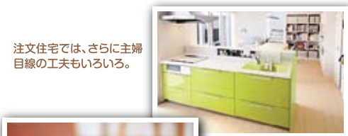
注文住宅では、さらに主婦目線の工夫もいろいろ。

独身女性、セカンドライフ世代も手に入る戸建、資産運用 独身女性なら、結婚などで住めなくなったら賃貸にもできるマイホーム。広すぎる家にお住まいの60代以上では、半分サイズのコンパクト住宅に賃貸専用ローコスト住宅の併設する方も増えています。戸建賃貸は人気の物件で、9割近くの物件が完成前に入居者が決定。アパートに比べて入居率も格段に高いので、安定した賃貸経営が可能です。