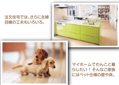
注文住宅では、さらに主婦目線の工夫もいろいろ。

2013年、さらに上質の住まい心地 土間、パントリー、サンルーム 外気の侵入を防ぐ風除室、物置や食品庫にもなる土間(ユーティリティ)、そしてコンテナガーデンや物干し場にも使えるサンルーム。こうしたスペースは、収納力や使い勝手の重要なポイントとしてお客さまのニーズ