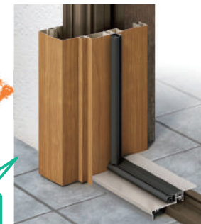
新しいドア枠でカバー