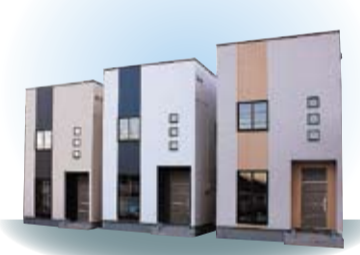
コストパフォーマンスの高い クリエイトホームズの家で夢を実現

20代でも、契約社員でも、ローン選びもおまかせ! Aさん(20代夫婦) 「夫婦ともに契約社員で収入は2人合わせて350万円程度です。でもできる範囲で資産を作っていくとマイホームを計画。正社員じゃなくても住宅ローンを組める。」