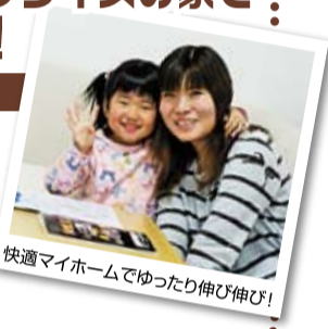
快適マイホームでゆったり伸び伸び!

最初に出かけた内覧会で即決です。担当営業さんとじっくり話し合い、無理のない予算で欲しい広さのマイホームが実現しました。広々リビングでかけまわる娘にとって、もうひとつのお気に入りには初めてもらった子ども部屋!この子の成長がますます楽しみです。