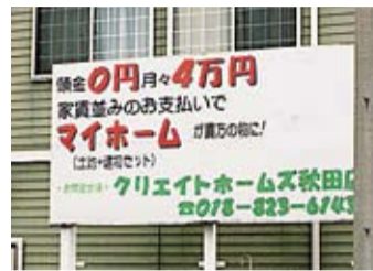
この看板が気になり始めたら、そろそろマイホーム?

20代でも、契約社員でも、ローン選びもおまかせ! Aさん(20代夫婦) 「夫婦ともに契約社員で収入は2人合わせて350万円程度です。でもできる範囲で資産を作っていくとマイホームを計画。正社員じゃなくても住宅ローンを組める。」