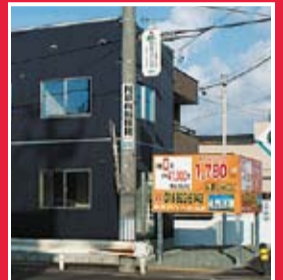
この看板を見かけたことはありませんか?

クリエイトホームズが提供する看板収入つき住宅は、敷地内に貸し看板スペースを設置することで、看板広告収入を毎月得られるというものです。幹線道路や人通りの多い場所にある建売住宅限定で、毎月1万円がお手元に! 看板収入はクリエイトホームズが10年間保証します。