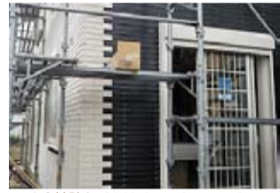
FLC外壁タイルはメンテナンスフリー