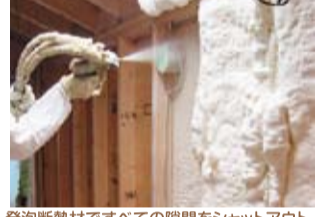
発泡断熱材ですべての隙間をシャットアウト

住まいの断熱性もまた、重要な要素。外気を遮断し、快適な温度と湿度で24時間換気することで、冷暖房費を大幅に抑え、カビやアレルギーのもとになる湿気・ホコリをシャットアウト。クリエイトホームズがオプションプランとしてご提案するアイシネン(発泡系断熱材)工法は、フロンや代替フロンを使用しません。