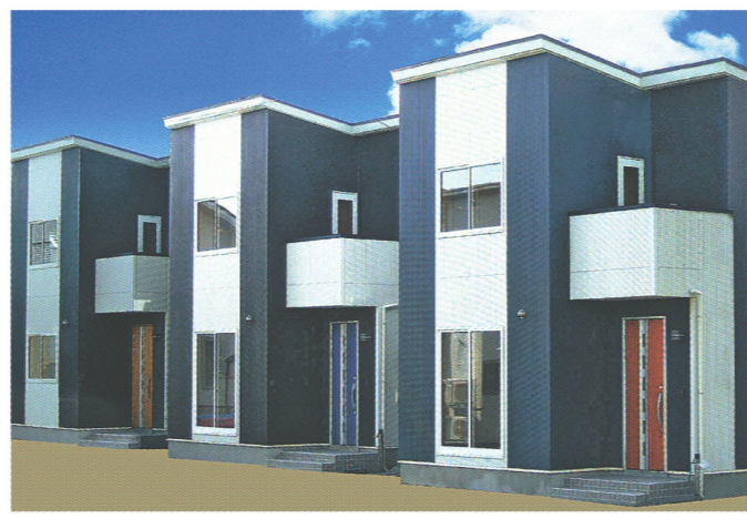
クリエイトホームズが建設した戸建て賃貸住宅。(写真上から)横手市の5棟、秋田市八橋の2棟、同市御所の3棟